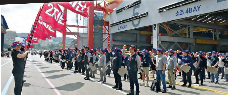
대통령실 왼쪽: 2025년 9월 4일, 대통령과 양대노총 위원장이 울산 대통령실에서 사진촬영을 하고 있다. 9월 3일 민주노총은 사회적 대화 참여를 결정한다. 오른쪽: 2025년 9월 3일, 울산 현대중공업 노동자들이 임금협상 투쟁 승리를 결의하고 있다.

지난 십여 년 사이에, 두 명의 대통령이 탄핵되었다. 수십만 명이 부패에 항의하고, 민주주의적 권리를 방어하고, 보다 덜 잔혹하게 착취당하고 덜 다치는 온당한 일자리를 확보하고, 더 많은 성평등과 그 외의 많은 것을 쟁취하기 위하여 거리로 쏟아져 나왔다. 지배 엘리트들은 혼란에 빠져 있었고, 대중들은 더 이상은 같은 방식으로 지배 받고 싶어 하지 않았다. 그러나 2017년, 그리고 2025년에 다시 한번, 자본가 지배계급은 정세를 안정화할 수 있었고, 인민들의 요구는 배신당했다.